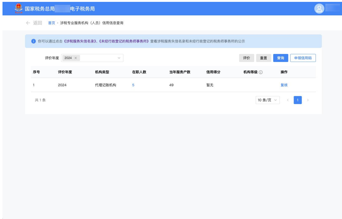
图 1 申领机构信用码入口

涉税专业服务机构通过企业登录的方式进入新电局后，按照涉税信息查询-涉税专业服务机构（人员）信用信息查询的菜单路径进入功能。