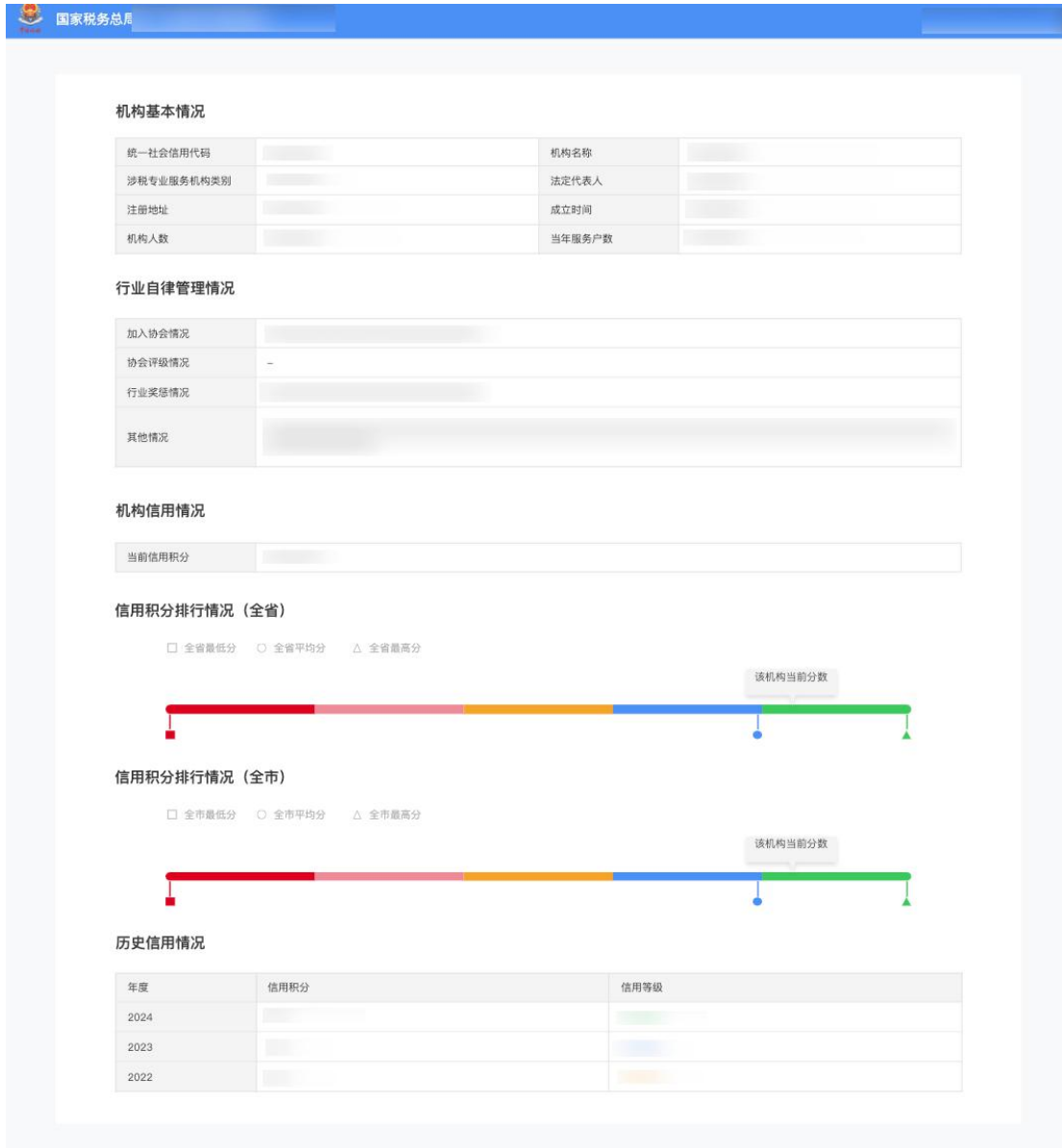
图 4 查看机构信用码详情