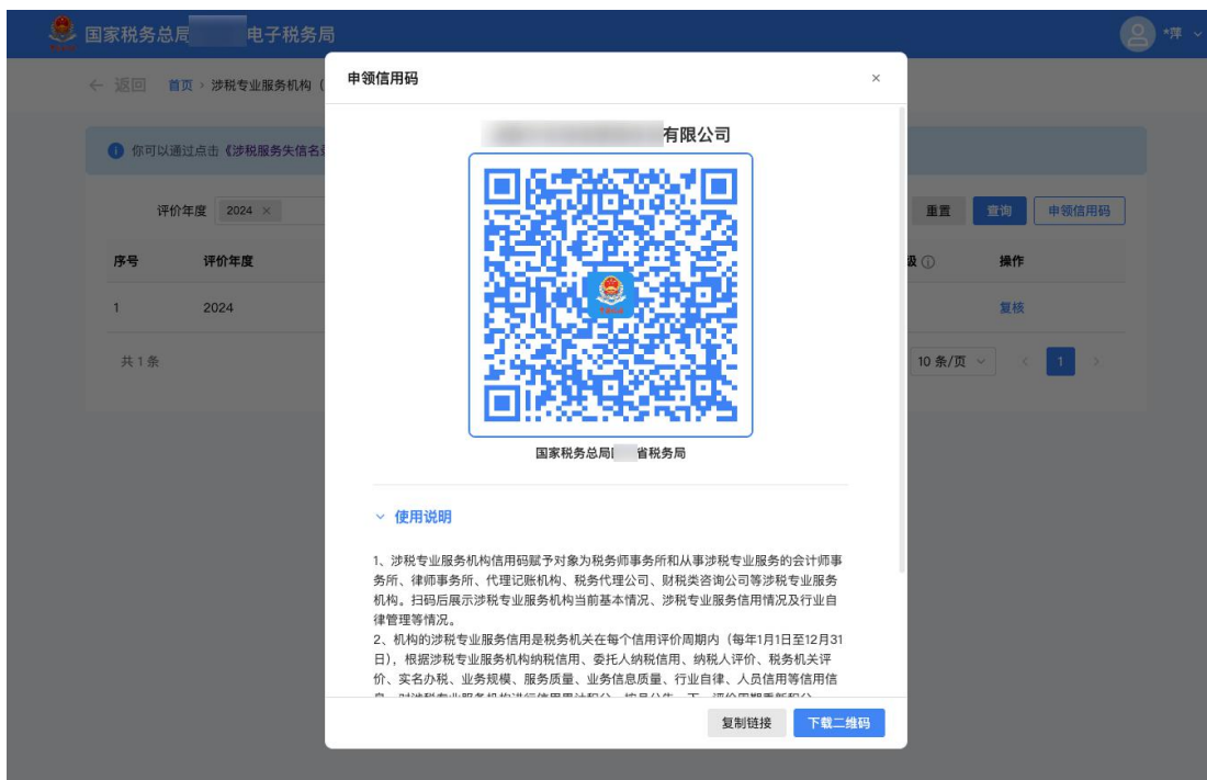
图 2 申领机构信用码弹窗